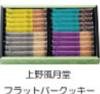
上野風月堂 フラットパーカー