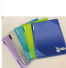
クリアホルダーブック