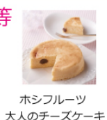
ホシフルーツ 大人のチーズケーキ