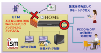
セキュリティ関連商品