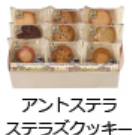
アントステラ ステラズッキー