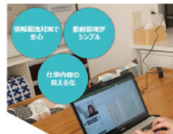
テレワークサポーター