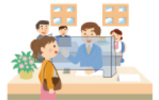
飛沫防止パーテーション