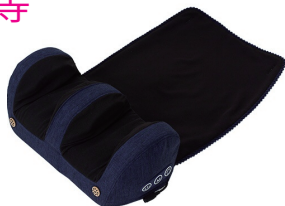
フットマッサージャー