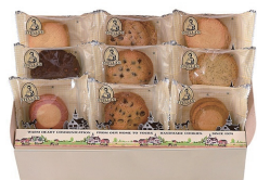
アントステラ クッキー