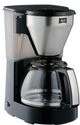
メリタ コーヒーメーカー