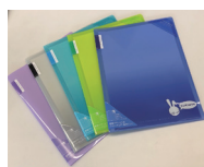
クリヤホルダーブック